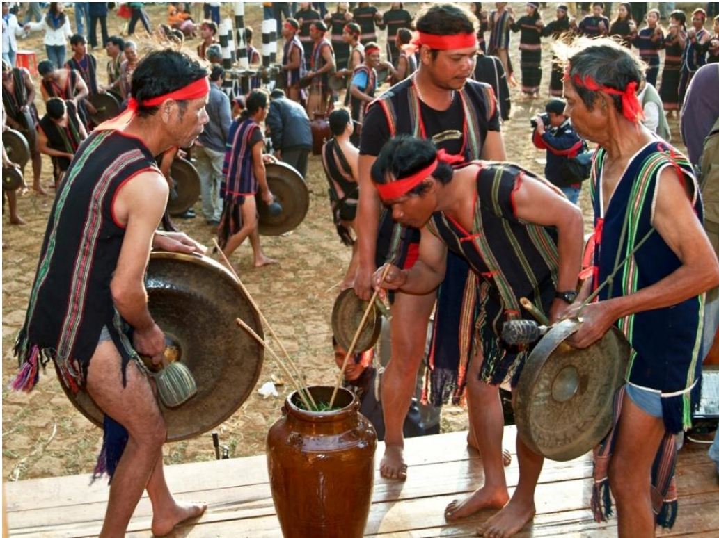
dân tộc thiểu số = ethnic minority

Chuyện kể rằng: Ngày xưa, ở đây có một đôi trai gái tên là K'Bri và K'Dam. Họ là người K'Ho, một dân tộc thiểu số sống ở vùng này.