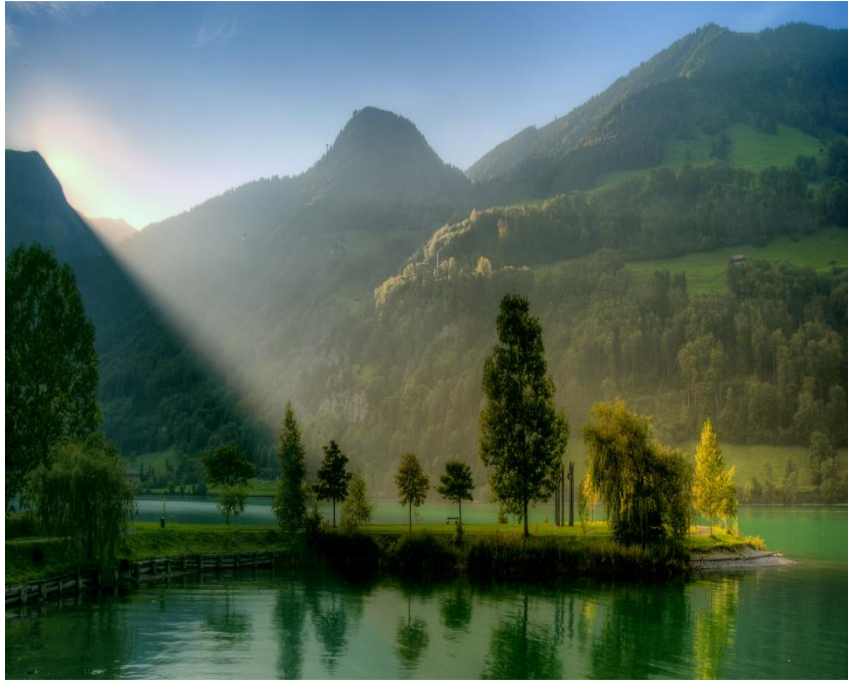
núi đồi = mountains and hills

Xung quanh bạn có rừng cây, núi đồi, và sông hồ.